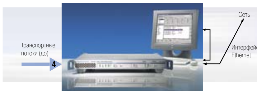
Интерфейсы и функциональные модули R&S DVM100 (слева: плата анализатора, справа: контроллер) показаны с органами локального управления – монитором, клавиатурой и мышью

В базовой конфигурации R&S DVM100 может одновременно контролировать два транспортных потока. Для этого два из четырех входов платы анализатора используются как входы транспортных потоков, а два других – как сквозные выходы. При необходимости, выходы можно перестроить в режим входов, что позволяет осуществлять мониторинг четырех транспортных потоков одновременно.