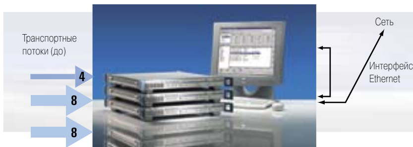
R&S DVM100 (слева сверху: плата анализатора; справа: контроллер), дополненный двумя R&S DVM120 (внизу: по 2 платы анализатора в каждом), показан с органами локального управления – монитором, клавиатурой и мышью